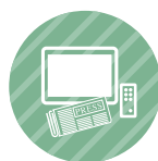
Medios de Comunicación